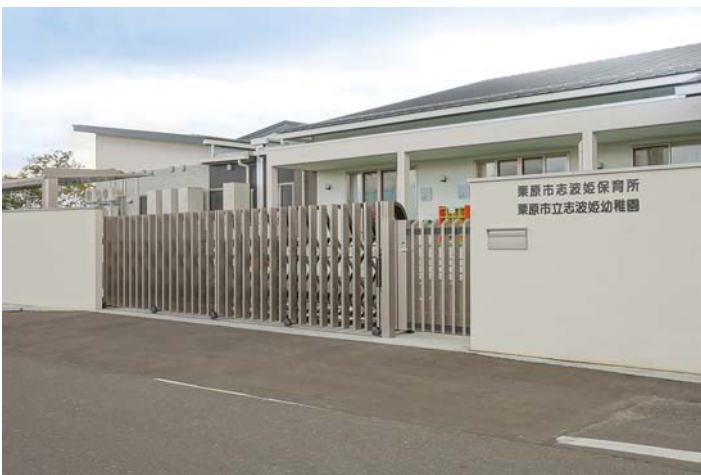
保育所・幼稚園への施工例